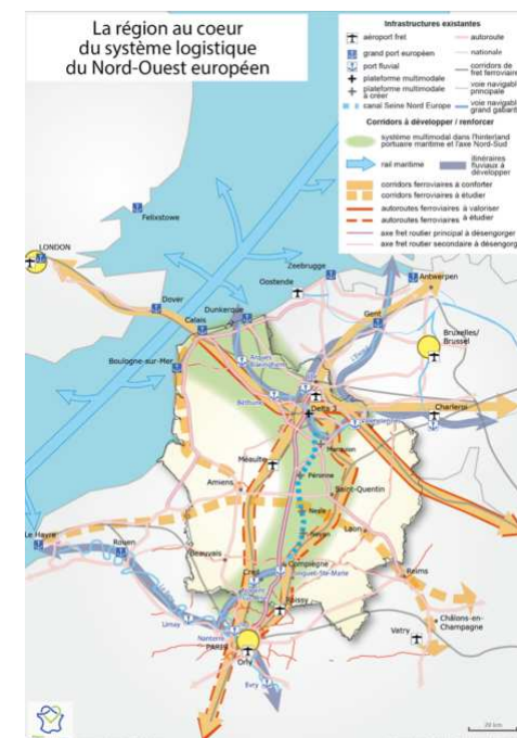
Carte des enjeux logistiques régionaux

La délégation générale au développement de l'axe Nord rattachée au CCILAN et placée auprès du préfet de région, pour rendre opérationnelles les décisions du conseil